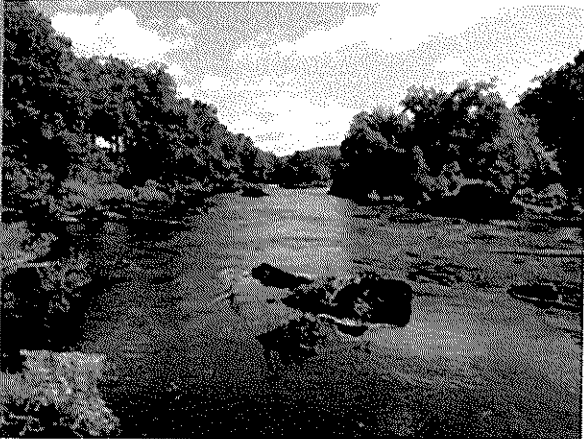
Die Dordogne zwischen Argentat und Beaulieu