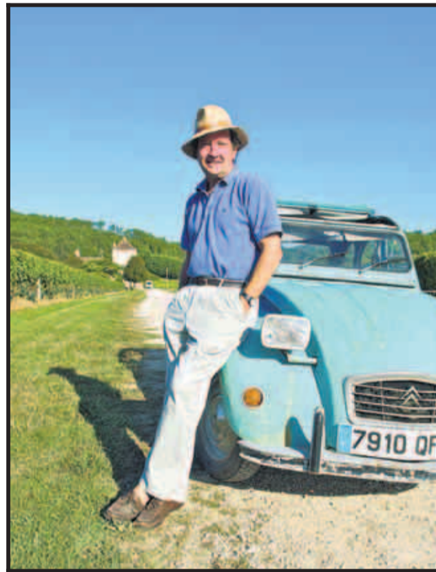
Der Schotte Martin Walker lässt seinen Kommissar im Périgord tätig sein, das nicht nur malerisch ist, sondern in dem es auch ziemlich mörderisch zugehen kann

„Ja, die Geschichte ist immer dabei. Das fasziniert mich so an den Franzosen“, kommt Walker ins Schwärmen, „dass sie sich ihrer Geschichte viel stärker bewusst sind als die meisten anderen Europäer. Daher habe ich mir auch erlaubt, „Bruno, Chef de Police“ mit einer Militärparade, der zum 8. Mai, beginnen und mit einer ebensolchen, der zum 18. Juni, enden zu lassen.“ Am 18. Juni gedenkt man in Frankreich des Generals de Gaulle, der sein Land 1940 aufforderte weiterzukämpfen – von London aus, wie der langjährige Kriegsberichterstatter Walker hier nicht ohne vaterländischen Stolz hervorhebt.