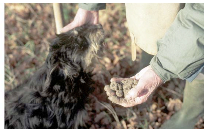
TATBESTAND TRÜFFEL. In seinem dritten Fall verfolgt Walkers Dorfpolizist Bruno Fälscher von wertvollen Trüffeln.

um Lebensmittel, und das Thema ist plötzlich tödliche Realität geworden. Müssen wir uns angesichts der Sprossen-Epidemie vor dem Essen fürchten?