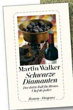
TATORT PÉRIGORD. Der gebürtige Schotte Martin Walker hat sich im legendären Périgord niedergelassen. Sein dritter Fall: „Schwarze Diamanten“, Diogenes, 23,60 Euro.

matisieren Lebensmittelskandale und zeigen wenig schmeichelhafte Porträts grüner Politiker. Was beabsichtigen Sie damit?